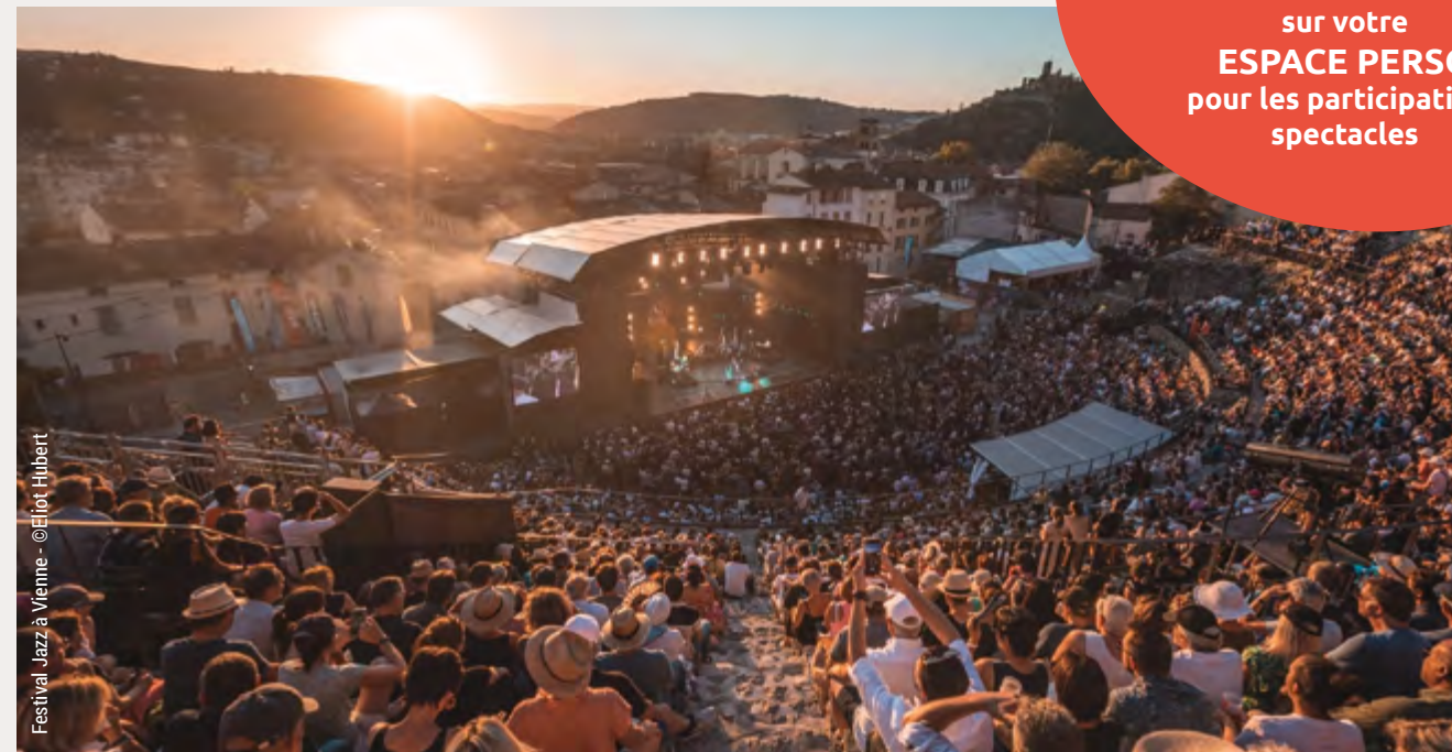
Festival Jazz à Vienne

Retrouvez toutes les modalités sur : www.cos38.com