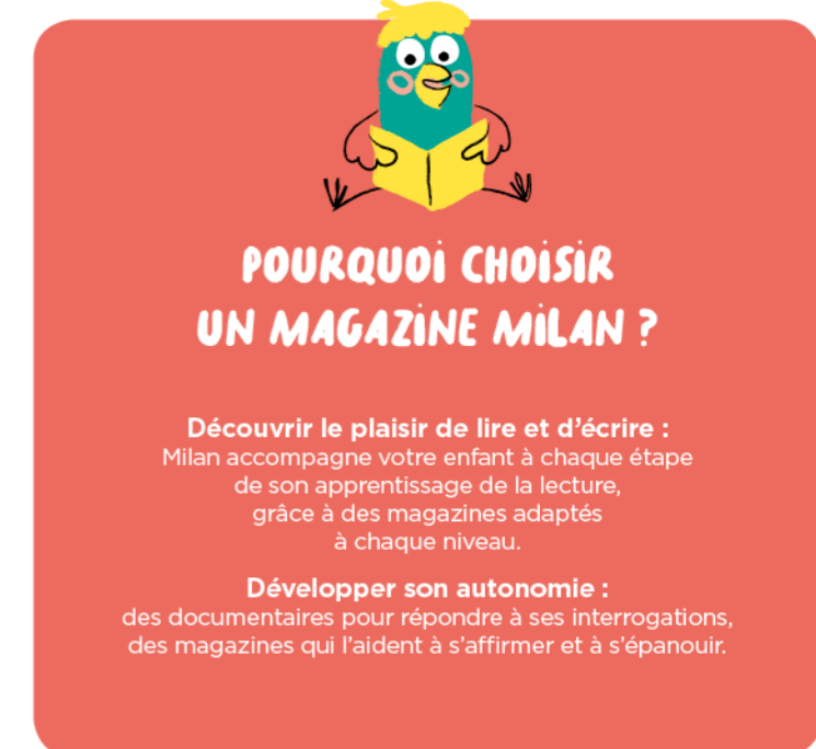
Illustration : Mylène Rigaudie